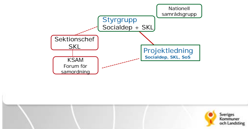
Figur 4.1 Parternas grupper för att styra överenskommelsen

Styrgruppen består av företrädare för Socialdepartementet och SKL. Socialdepartementet företräds av enhetschefen på Enheten för familj och sociala tjänster. SKL representeras av sektionschefen för enheten för vård och socialtjänst. Styrgruppen har lett arbetet med att utveckla plattformen och överenskommelsen. Det formella beslutet om att ingå avtal fattas av regeringen och SKL:s politiska ledning.