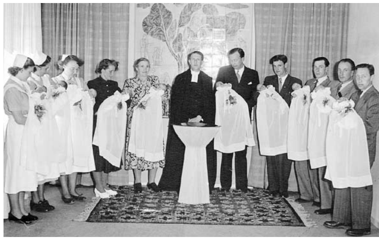
Tid för dop i det gamla doprummet, någon gång på 1950-talet.

Så småningom fick pappan börja närvara vid förlossningen,