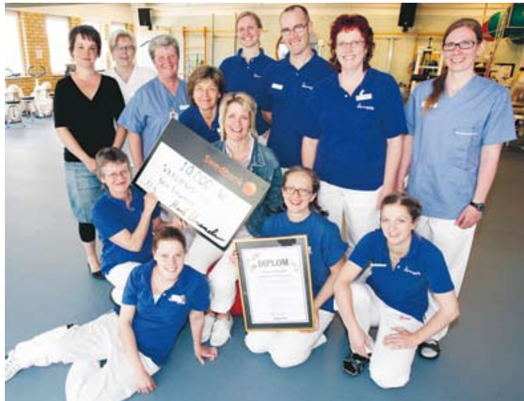
Personalen på Sjukgymnastiken på Falu lasarett är stolta och glada över att ha vunnit pris som Årets Mönsterarbetsplats. Prispengarna kommer att användas till något trevligt för hela personalen.