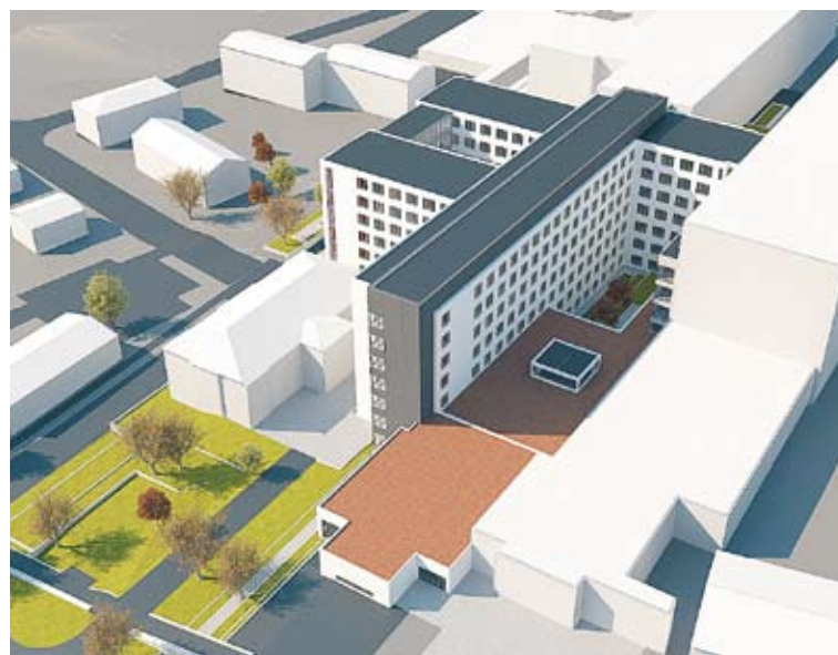
Övre bilden visar den nya vårdbyggnadens sydfasad som den kommer se ut år 2013.