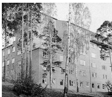
Gamla kvinno-kliniken – från 1950-talet fram till idag.