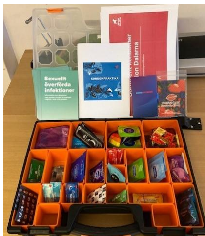
Innehåll i kondomlåda.

När jag tillträdde denna tjänst så har var min tanke att försöka utöka samarbetet med elevhälsa i Dalarna . Dels ville jag presentera mig själv och berätta lite om vad jag kan tillföra och stötta med men även för min egen skull, för att få en bättre förståelse för de utmaningar och frågeställningar som en skolsköterska eller kurator ställs inför i gällande sexualitet och hälsa. Jag tänkte mig detta i form av en slags "turné" där jag åker runt och besöker er på hemmaplan men pandemin satte ju stopp för dessa planer. Nu hoppas jag verkligen att det finns en möjlighet att starta detta projekt och att jag kan komma igång med att besöka er. När jag kommer till er så kommer jag att ha med mig lite artiklar som jag tänker överlämna till er som förhoppningsvis kan vara till nytta i ert möte med de unga. Bland annat kommer jag att ha med mig en sk kondomlåda som är fylld med olika sorters kondomer som kan vara till hjälp för er när ungdomar kommer och vill ha gratis kondomer (se bild nedan). Om ni känner att ni är intresserade av ett kort möte med mig där vi pratar lite förutsättningslöst och jag får överlämna mitt material till er så kontakta gärna mig via telefon eller mail så bokar vi in en träff. tfn 023-49 07 48 eller pia.haqwinzon@regiondalarna.se Jag ser fram emot att träffa Dig och lära mig mer om elevhälsoarbetet i Dalarna!